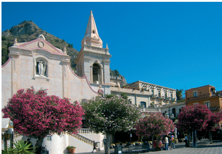
Kościół w Taorminie

Wnętrze – Gotycka budowla na planie krzyża łacińskiego prezentuje nawę główną oświetloną ostrołukowymi okienkami i połączoną z nawami bocznymi ostrołukowymi arkadami, spoczywającymi na kolumnach z różowego marmuru. Na drugim ołtarzu prawej nawy możemy podziwiać piękny poliptyk z XVI w., autorstwa Antonella de Saliby.