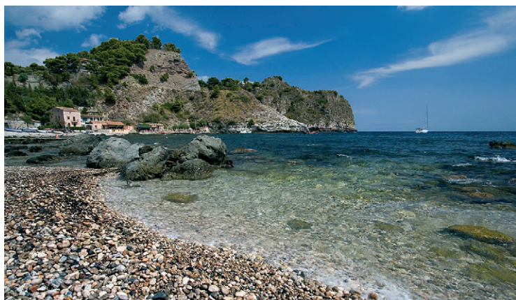
Plaża w Taorminie