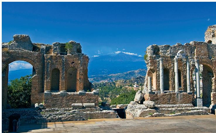
Teatr grecki w Taorminie

odzwierciedla ukształtowanie terenu, a niektóre stopnie cavei zostały wycięte bezpośrednio w skale. Grecka budowla składała się ze zredukowanej orkiestry dla muzyków, chórzystów i tancerzy. Rzymianie zlikwidowali pierwsze rzędy stopni, aby przekształcić je w okrągłą arenę, dostosowaną do igrzysk cyrkowych, i dodali korytarz wejściowy dla gladiatorów i dzikich zwierząt.